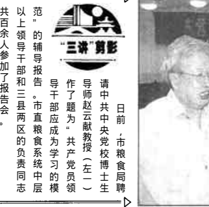
日前，市粮食局聘请中共党校教授(左一)作题为“共产党人的模范”的辅导报告。市直粮食系统中层以上领导干部和各县两区的负责同志共百余人参加了报告会。

同时，机关各科室、稽查大队为支持班子搞好“三讲”教育，放弃休息时间，加快工作节奏，提高工作效率，齐心协力保油田稳定，促进经济发展。机关科室白天深入基层站点和油田施工作业现场，晚上集中研究当前的形势和油区工作；稽查大队加大了对油区的监控力度，科室长住站督查，各中队24小时值班，使一批盗窃和非法运输油田油品油料物资器材的不法分子相继落网，避免了国家财产损失，支援了地方化工企业的发展。(本报通讯员)