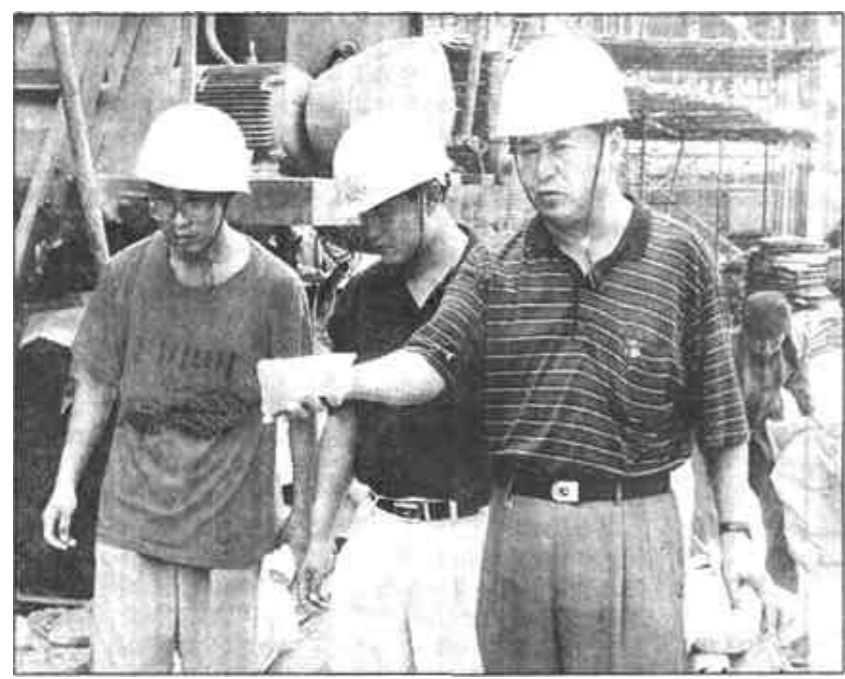
日前，在由市建管局组织的工程质量抽查中，在某工地的砼搅拌站，检查人员发现，该施工队使用的是已经潮解的水泥，检查人员当场对其进行了处理。